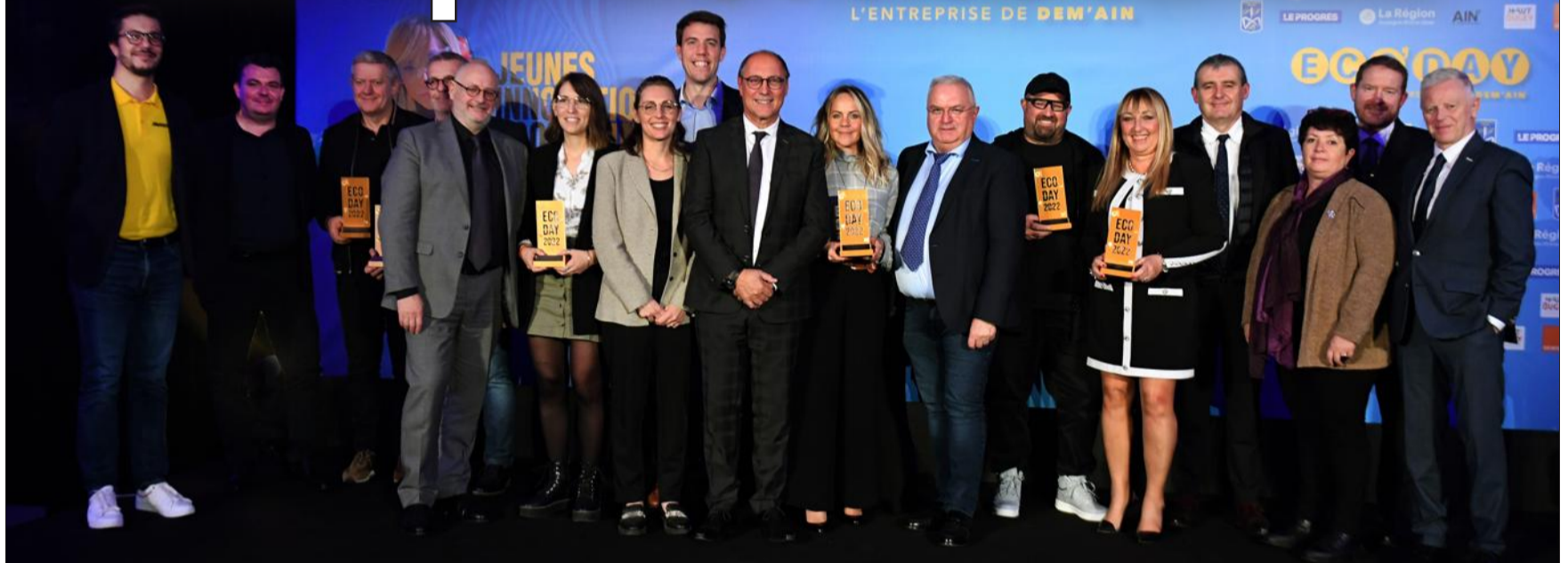
La 14 e édition des Trophées de l'entreprise du Progrès de l'Ain, l'Eco'Day, s'est tenue ce jeudi à Ainterexpo, à Bourg-en-Bresse. PAGES 12-13