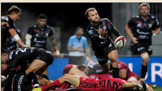
PAGE 34 Oyo se déplace à Agen, 2 e de Pro D2.