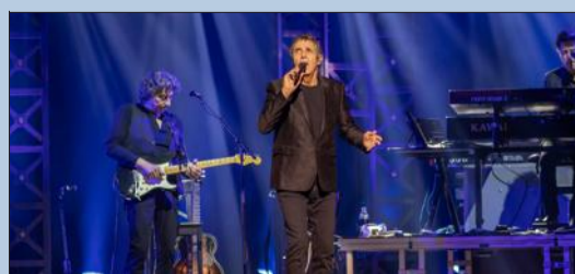
L'artiste vient chanter son dernier album.