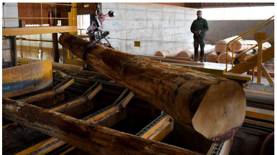
Le département compte neuf filières d'excellence.