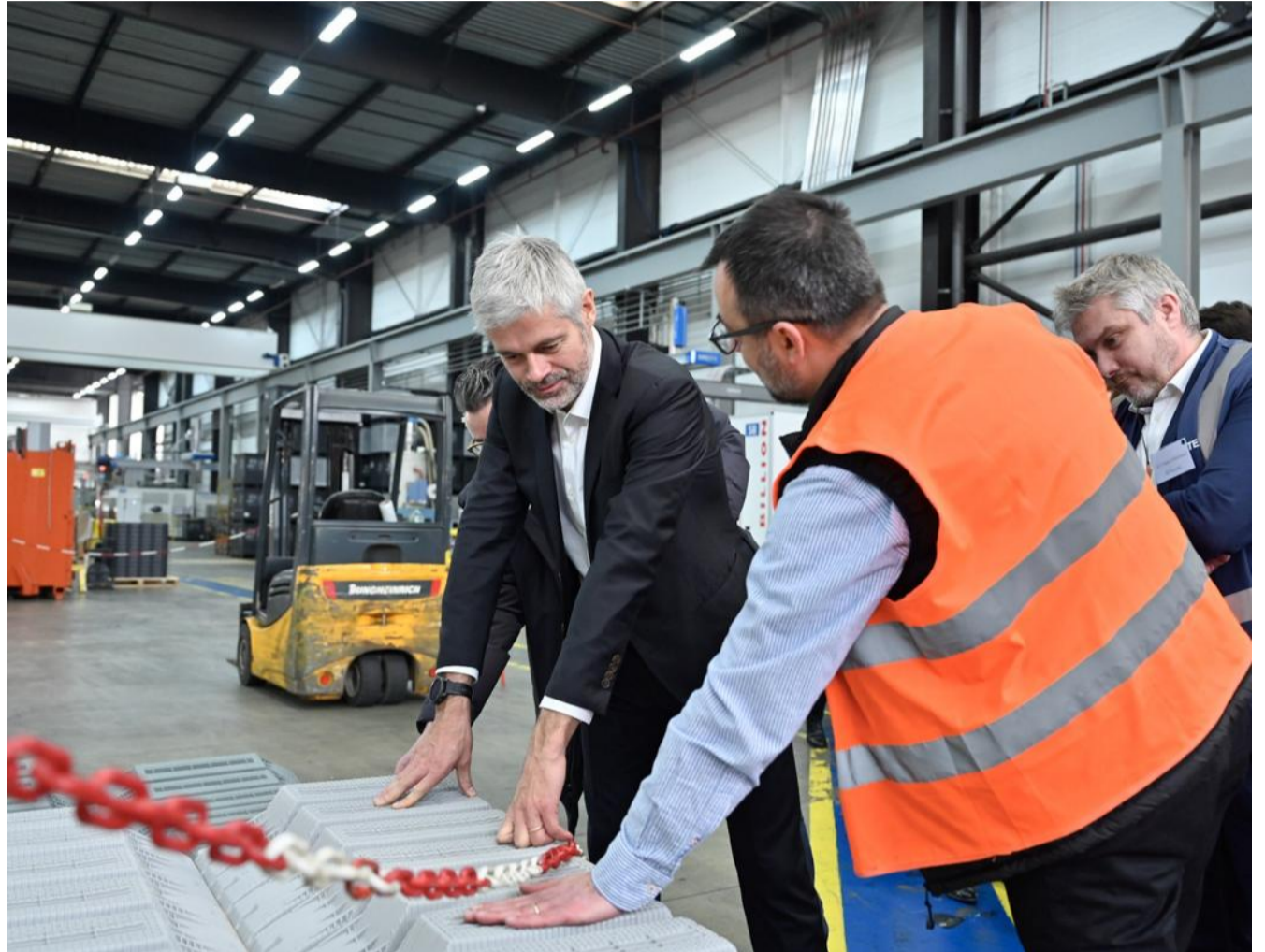
« Afin de favoriser l'activité de nos entreprises, nous appliquons un principe à l'ensemble de nos marchés publics : la préférence régionale », souligne Laurent Wauquiez, le président de la Région Auvergne-Rhône-Alpes.

« Remettre ce trophée, c'est mettre à l'honneur la conception de l'entreprise que nous défendons à la Région : l'enracinement, la recherche du progrès et la production au cœur de nos territoires. Plus que des acteurs majeurs du dynamisme local, les chefs d'entreprise incarnent un modèle pour nos jeunes et véhiculent des valeurs essentielles à la souveraineté du pays : la volonté d'entreprendre, l'innovation et la transmission aux générations futures. À travers leurs entreprises, ils sont les ga-